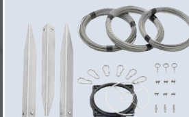
Крепежные элементы Быстрая и надежная фиксация аэратора благодаря крепежным элементам, которые входят в комплект поставки.