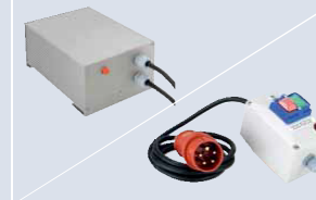
Штепсель заземления + пульт управления Готовая к подключению версия 230В поставляется вместе с пультом управления и штепселем заземления. Соединение CEE + выключатель защиты Версия на 400 В поставляется вместе с готовым к подключению, 5-контактным соединением CEE и выключателем защиты двигателя.