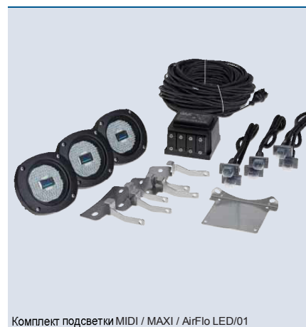
Комплект подсветки MIDI / MAXI / AirFlo LED/01